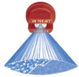
při tlaku 1 bar (15 PSI) při tlaku 4 bar (60 PSI)